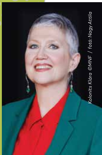
Kolonits Klára