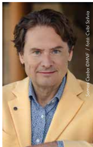
Somos Csaba