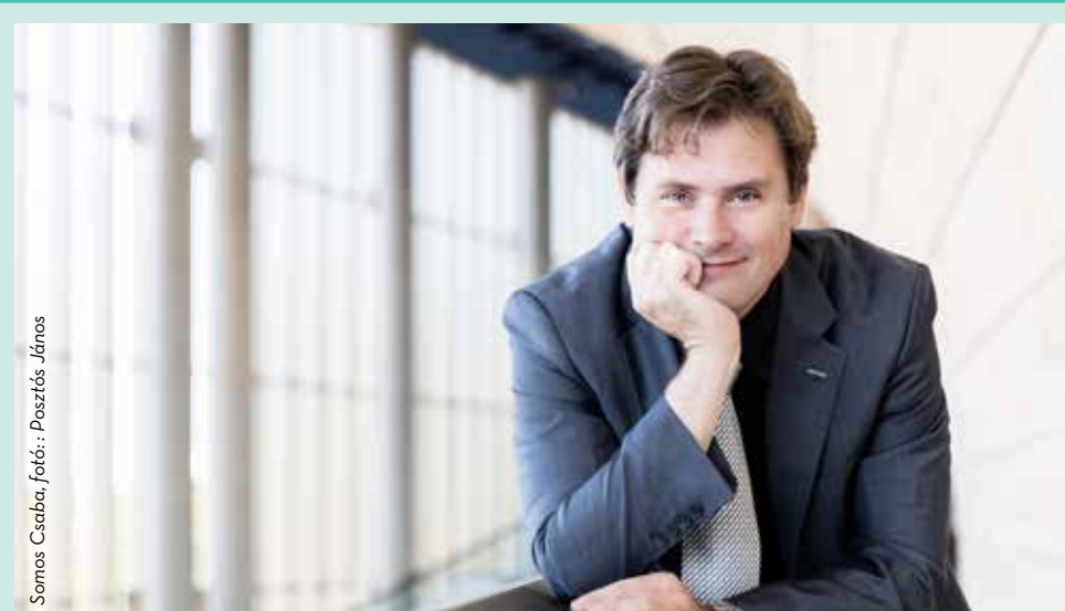
Somos Csaba