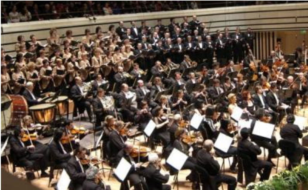
A Nemzeti Filharmonikus Zenekar és a Nemzeti Énekkar