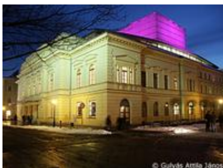
Székesfehérvár, Vörösmarty Színház